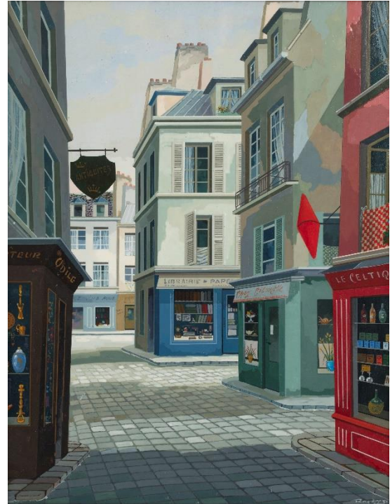
Saint-Germain-des-Prés , 1981 - huile sur isorel 34,5 x 27 cm - Courtesy galerie Dina Vierny