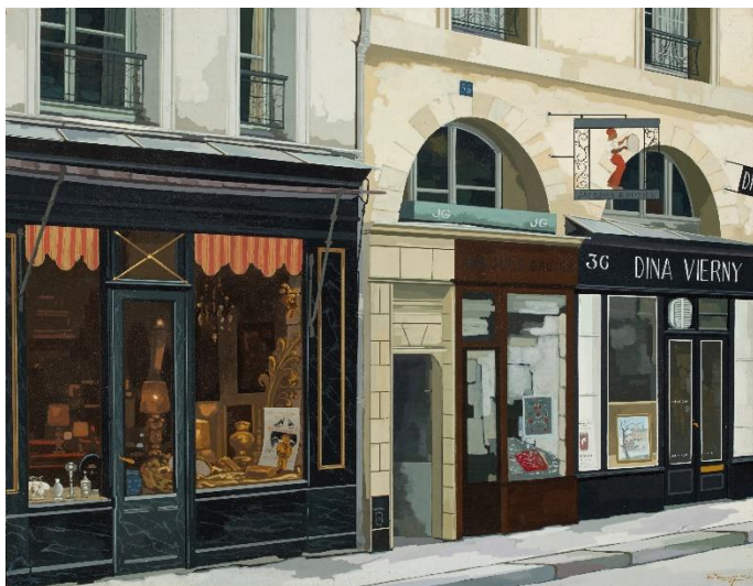
Racoff, Rue Jacob , 1976 - Huile sur isorel - 27 x 35 cm