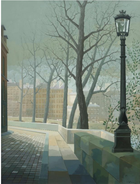
Quai de Seine , 1981 - huile sur isorel 35 x 27 cm - Courtesy galerie Dina Vierny

Racoff: 5 visuels disponibles pour la presse y compris celui en première page du communiqué