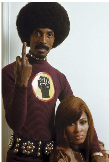
Tony Frank, le n° 2 de Salut Les Copains après Jean-Marie Perier réalise une photo de Ike et Tina Turner décapante.

Revisited, 1966, Digital C-print - 127 x 127 cm