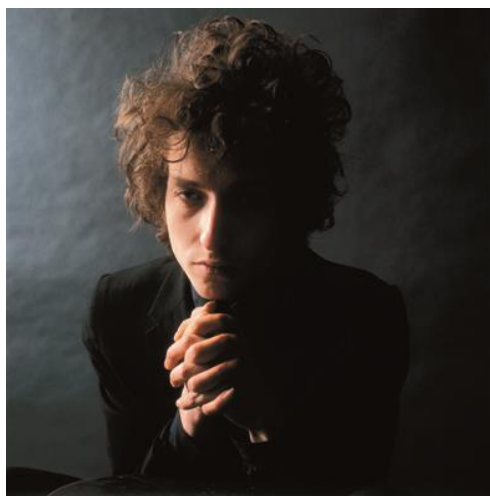
Jerry Schatzberg et Bob Dylan 1965-1967